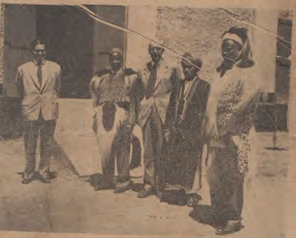
Chini: Wachezaji wa ngoma ya Kichagga wamo katika mavazi ya nguo za kikwao. Picha hii ilipigwa nje ya jengo la makao makuu ya Wachagga huko Moshi.