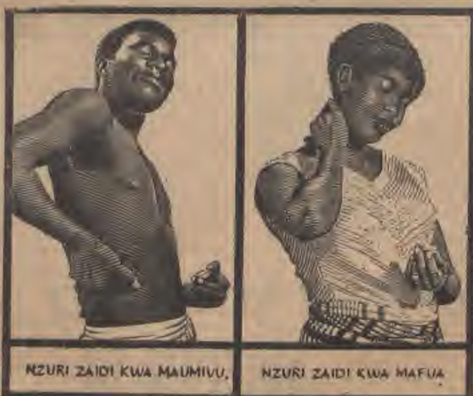
NZURI ZAIDI KWA MAUMIVU.

Yaendelea kusema TACA kwamba ni wajibu wa kila kabila kuwapata viongozi kutoka miungano mwao kutudi viongozi hao wa kikabila wa wote kuangalia kazi za uchungu kwa ajili ya kusitawisha elimu alya na starehe za makabila yao. Kwa ajili ya sababu hizo za juu TACA inasolea kwamba "Upper House" ya Lelito hmdwe na makabila hayo 120, mitambo imoia kutoka kila kabila.