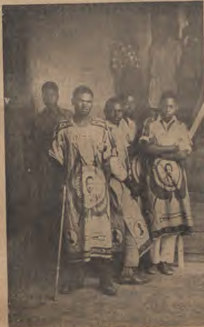
KWELI jamaa kote wanalilia UHURU. Vijana wa kwaya ya TANU tawi la Moshi waliwatumbuiza waliohudhuria mkutanoni.

Juu ya umoja huu baina ya Waarabu na Waafrika, pengine, tamko lililopenya zaidi lilitoka kwa mmoja wa Waafrika wa Unguja amba-