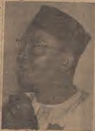
Dr. Nnamdi Azikiwe, Waziri Mkuu wa Eastern Nigeria, ambaye kwa hivi sasa yuko mjini London akihudhuria mkutano unafanyika huko kuhusu utawala wa siku zijazo wa nchi ya Nigeria. Wakuu wa Nigeria wanataka wajitawale mwaka wa 1960.

Bwana Lennox-Boyd, Waziri wa Makoloni, ambaye aliufungua mkutano huo,