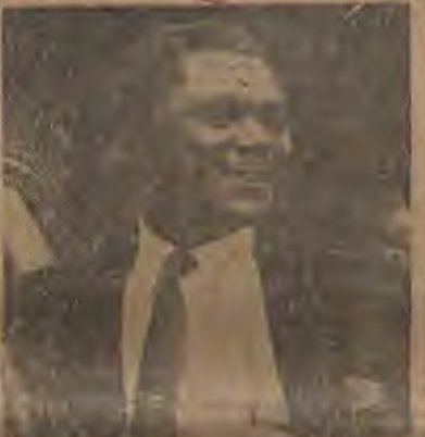
MHE. J. NYERERE

Daily Telegraph linasema kuwa Bw. Nyerere anataka kuona taifa la Watanganyika ambalo Wazungu na Waasia watakoa kusaidia kuwaelimisha watu na kusitawisha nchi - "karibu ni yeye tu katika viongozi wa Kiafrika ambaye anaona lazima ya kuhakikisha haki za kibinadamu na mali bila kujali rangi."