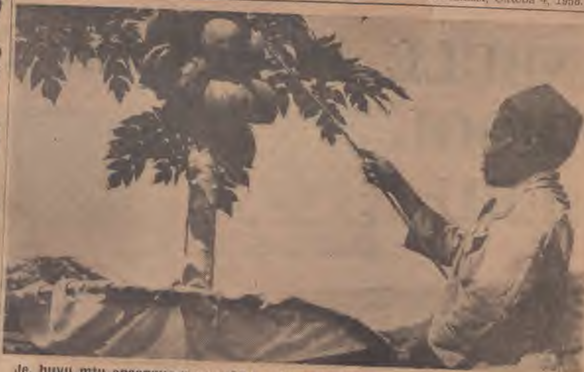
Je, huyu mtu anaangua mapapai? La, hiki ni kilimo kingine chenye faida sana nchini. Hapa matunda ya mpapai yanachanjwa kwa wembe ili yatoe utomvu.

(Associated with H. & G. Simonds Ltd., Reading, England)