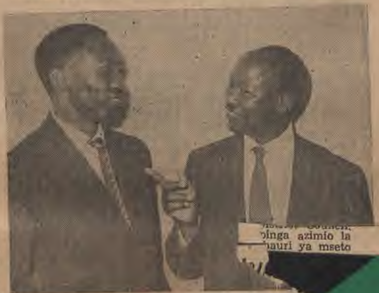
... Council... ... pinga azimio la... ... hauri ya mseto

WAPIGA MUZIKI HUPENDI KILA MAHALI WAFANYE Hohner KUWA MARAFIKI ZAKO