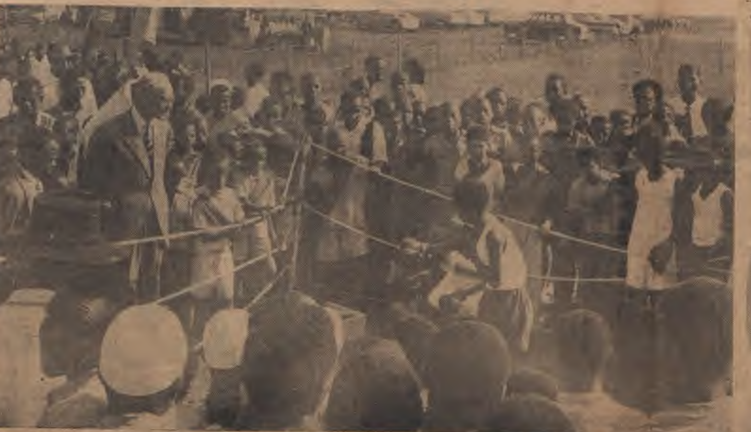
Bwana Gavana amezungukwa na kundi la watoto na wa tu wengine waliokuwa wakiangalia mchezo wa kupigana ngumi uliofanywa na Chama cha Vijana huko Moshi.